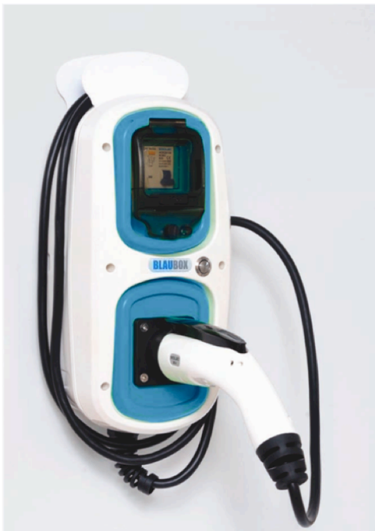
Tipo 1 SAE J1772